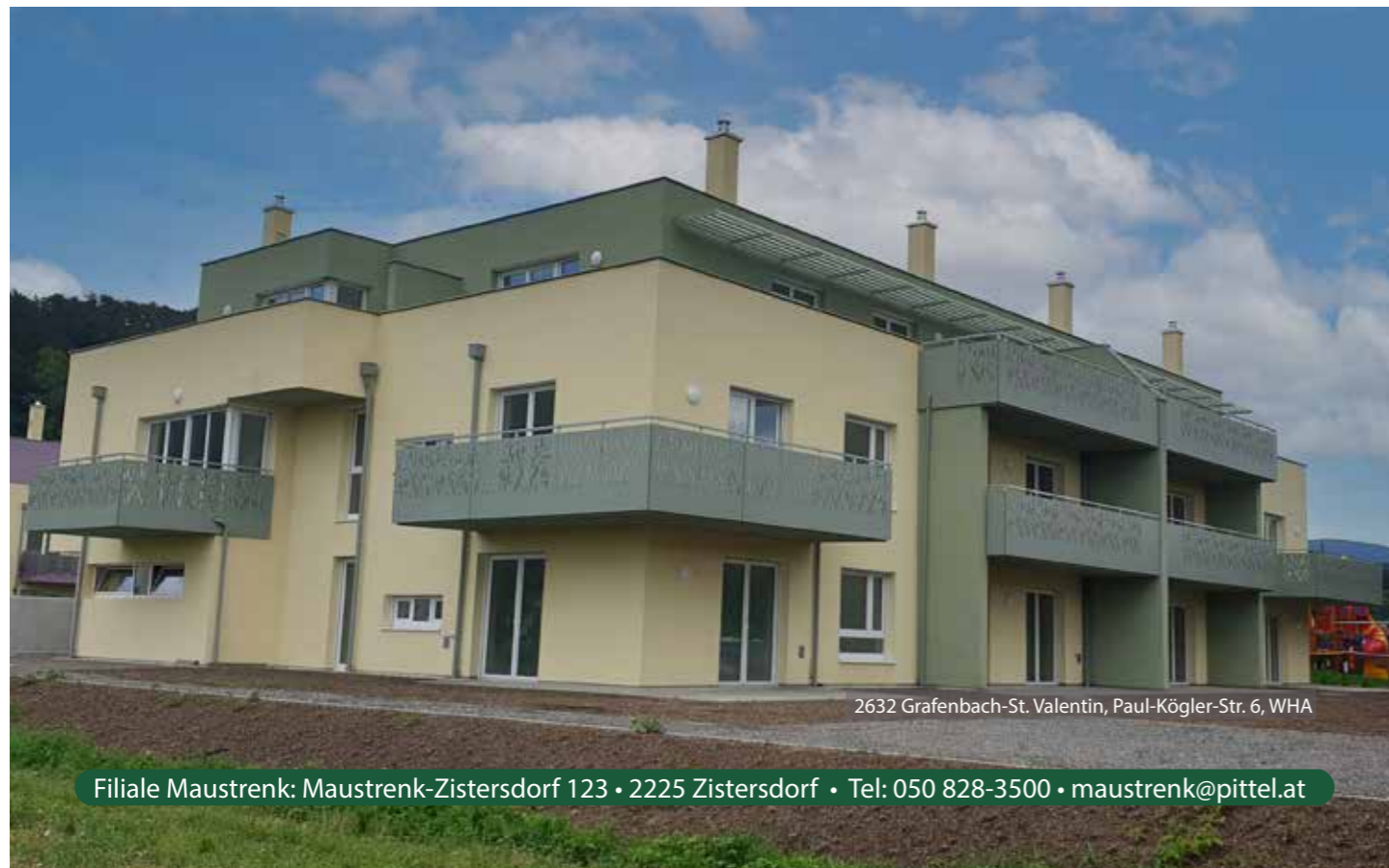
2632 Grafenbach-St. Valentin, Paul-Kögler-Str. 6, WHA

HOCHBAU • GENERALUNTERNEHMER • REVITALISIERUNG • INGENIEURBAU • STRASSENBAU LEITUNGSBAU • GOLFPLATZBAU • BRÜCKENBAU • GLEISBAU • PFLASTERUNGEN