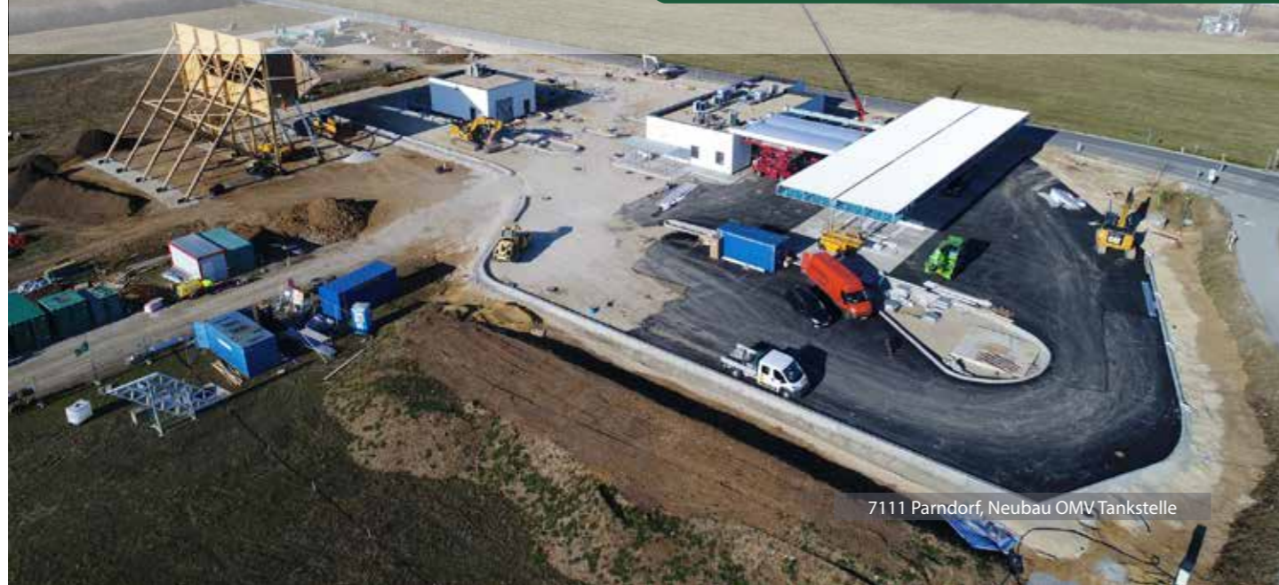
7111 Parndorf, Neubau OMV Tankstelle